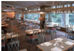
西洋料理 SATSUKI (1F)

お食事券はホテルニューオータニ大阪内レストランの他近隣の提携レストランでご利用いただけます※写真はホテル内の一部レストラン