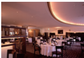
中国料理 大観苑 (3F)