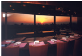
鉄板焼 けやき (18F)